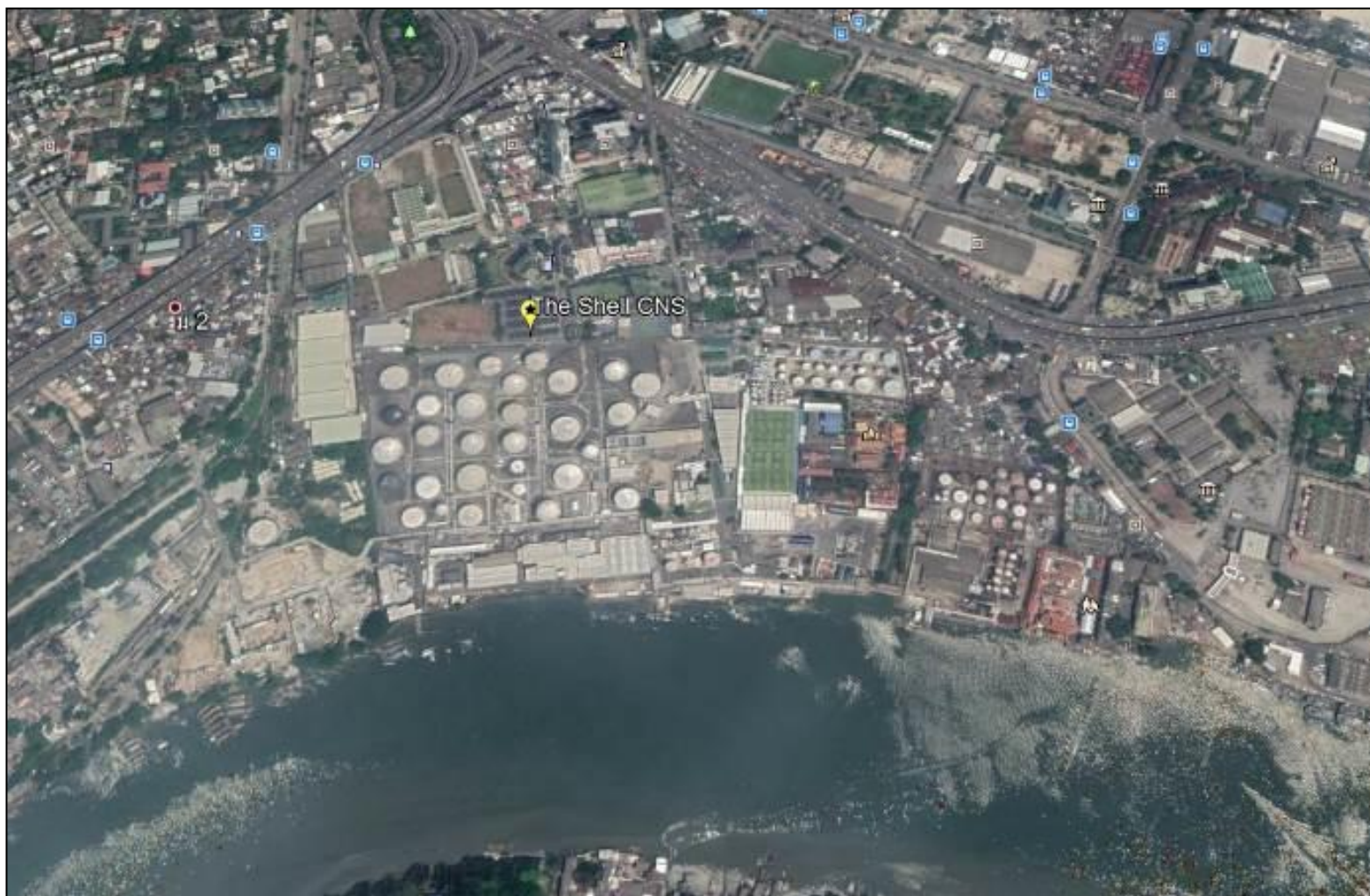
รูปที่ 1.4.2-1 แผนผังแสดงตำแหน่งท่าเทียบเรือและคลังน้ำมันเชลล์ชองนนทบุรี